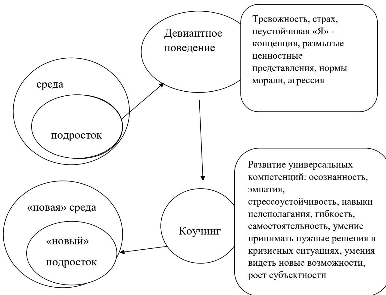
Рис. 1. Ресурсы коучинга в работе с девиантным поведением подростка

Важен профилактический аспект коучинговой стратегии работы с подростком. Коучинг может выступать как профилактический метод на ранних стадиях проявления девиантного поведения. Он эффективен в коррекции отдельных личностных особенностей и форм поведения, включающих формирование и развитие навыков работы над собой. Профилактика касается важнейших сфер жизни подростка – это семья, образовательная деятельность, интернет-среда, окружение, мечты и цели развивающейся личности.